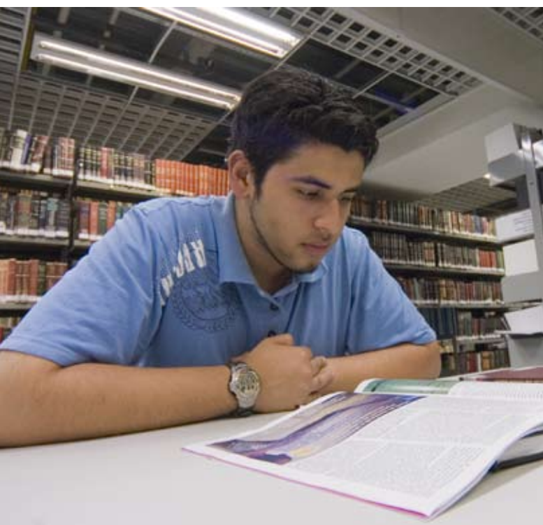
UNINOVE é responsável por 4% da produção científica brasileira

do de São Paulo que mais desenvolvem pesquisa institucional – cadastradas no Conselho Nacional de Desenvolvimento Científico e Tecnológico (CNPq).