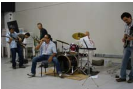
Show anima alunos na volta às aulas

Para reunir, animar e saudar os alunos, no dia 12 de fevereiro a instituição organizou um show instrumental com pitadas de rock, no campus Vergueiro. Devido ao sucesso da iniciativa, a banda “Mooça Musical” se apresentou novamente, quatro dias depois, na entrada do prédio D do campus Memorial.