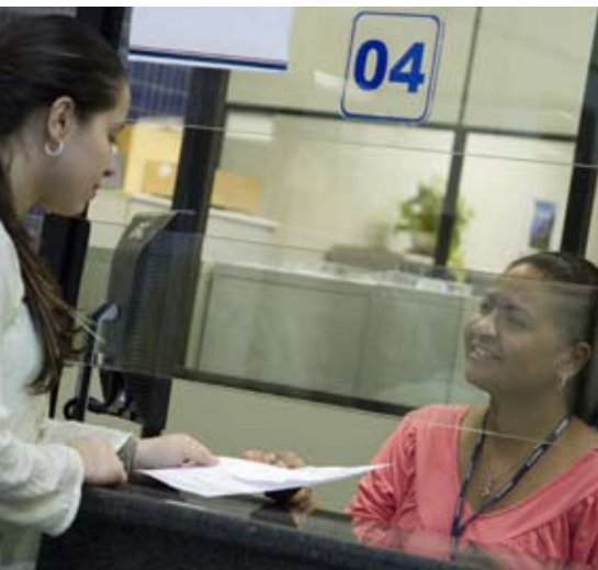
Comodidade: 70% dos serviços estão automatizados

P ara a comodidade dos estudantes, 70% dos serviços da secretaria agora estão automatizados. A grande parte dos pedidos pode ser solicitada por meio da Central do Aluno, no portal da UNINOVE, como também as dúvidas esclarecidas (via opção “Entre em contato”). Os universitários contam também com terminais de consultas (totens) espalhados em todos os campi, que permitem a checagem de notas, de horários e do histórico, com a possibilidade de impressão dos dados. Além disso, para uma maior praticidade, uma novidade já está à disposição desde abril: o chat on-line , direcionado aos setores de análise curricular e de expedição de documentos, que antes funcionava apenas para os casos de negociações.