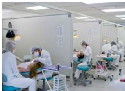
Serviço gratuito é realizado no campus Vergueiro

Na Clínica de Odontologia da UNINOVE, localizada à Rua Vergueiro, 235/249, próxima à estação São Joaquim do Metrô, a comunidade recebe atendimento gratuito de emergência para os casos de dores. O serviço é realizado todos os dias (exceto aos finais de semana), nos seguintes horários: às segundas, quartas e sextas-feiras, das 18h às 22h, e às terças e quintas-feiras, das 8h às 12h.