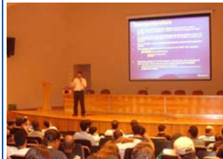
Evento é uma parceria da UNINOVE com a Microsoft

No dia 28 de março, no campus Vila Maria, a UNINOVE sediou o Robotic Day , iniciativa organizada pelo Microsoft Student Partner (MSP), com o apoio da Microsoft. Direcionado aos alunos dos cursos de Informática, o evento contou com palestras e demonstrações sobre aplicativos para uso em Robótica, lotando o Auditório Lydia Storópoli.