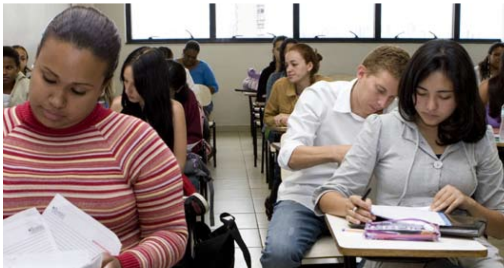
Valorização dos Superiores de Tecnologia é uma tendência atual, informa a SETEC

Por exemplo: os alunos do curso de Marketing (com duração de dois anos) podem conquistar a certificação de Qualificação Profissional de Práticas de Gestão de Equipes ao final do 1º semestre; ao término do 2º semestre, podem receber a certificação de Analistas Administrativos; já na conclusão do 3º semestre, podem adquirir a certificação de Analistas do Ambiente de Marketing; e, ao completar o curso, podem ser contemplados como Analistas de Mercado. Além das certificações, após a conclusão do curso Superior os estudantes adquirem o diploma Superior e podem ingressar em uma Pós-graduação Lato Sensu (Especia-