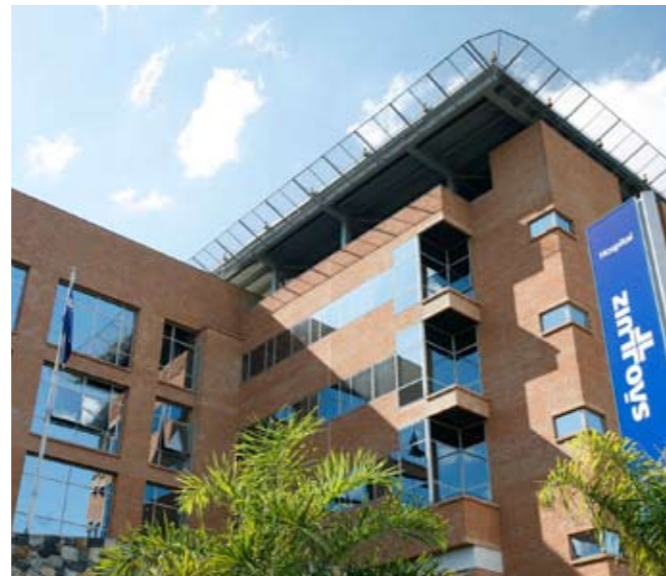
Hospital também contrata estagiários e trainees.