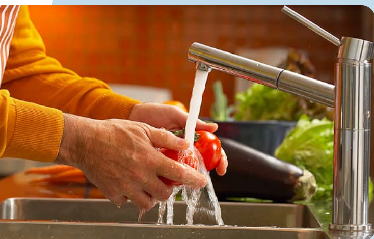
Para evitar a diarreia, lave as mãos e os vegetais e beba água tratada

A diarreia é a consequência mais comum de uma infecção gastrointestinal. A doença geralmente é causada por bactérias, vírus ou parasitas presentes na água ou em alimentos contamina-