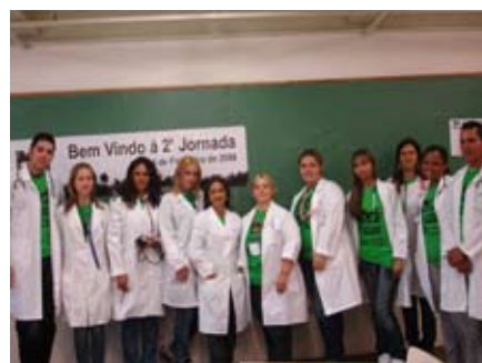
Evento conta com a ajuda de cerca de 70 universitários

Vídeos, oficinas e palestras sobre meio ambiente, moradia e políticas públicas, assessorias jurídicas coletiva e individual, atendimentos a idosos, música e atividades de lazer para crianças marcaram a 2ª Jornada Moradia e Meio Ambiente, realizada no dia 14