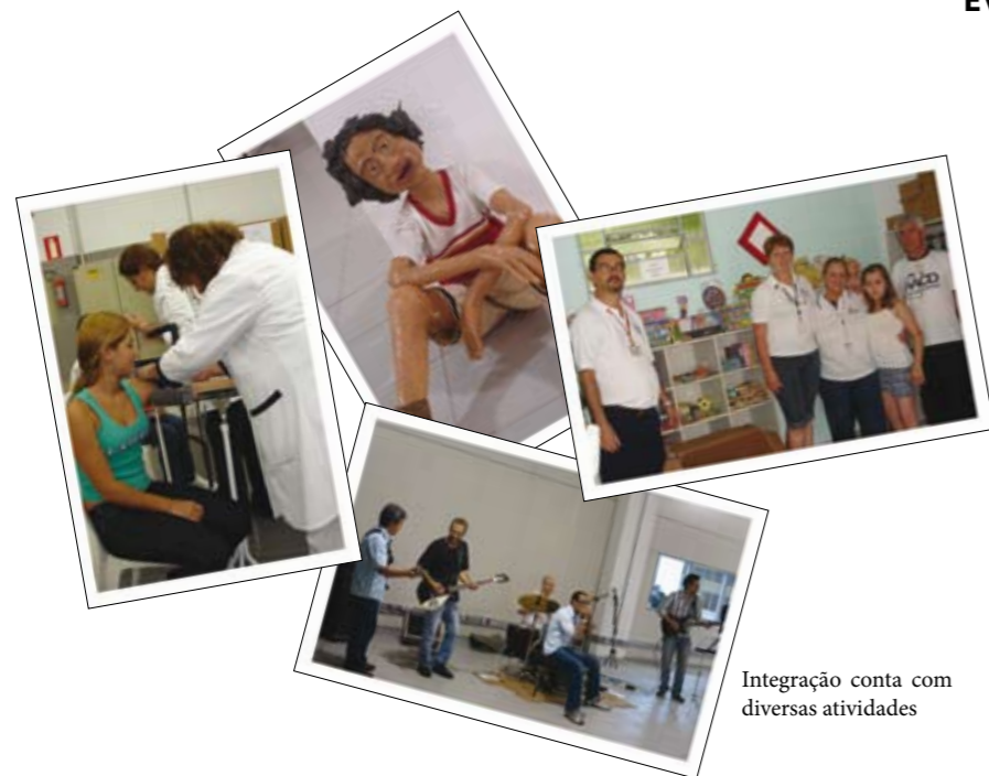
Integração conta com diversas atividades

Evento conta com 4.232 participações entre 841 turmas e 24.095 doações