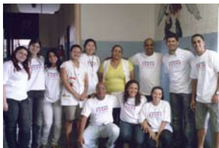
Donativos são entregues por alunos e professores

Cansados de ver situações desagradáveis na volta às aulas, os estudantes do curso de Farmácia e Bioquímica da UNINOVE largaram as tintas e cancelaram a bagunça para fazer uma ação solidária. Organizados pelo diretório acadêmico, calouros de três salas do campus Memorial arrecadaram, em três dias, 200 quilos de alimentos não-perecíveis, que foram doados a uma creche da Favela do Moinho, na região central de São Paulo. A entrega dos donativos foi realizada pelos alunos e coordenadores do curso. Os veteranos também foram convidados a participar da ação, que contou com o apoio dos estudantes do curso de Biomedicina e do departamento UNINOVE Transforma.