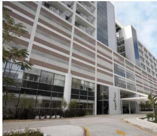
São Luiz valoriza a continuidade dos estudos.