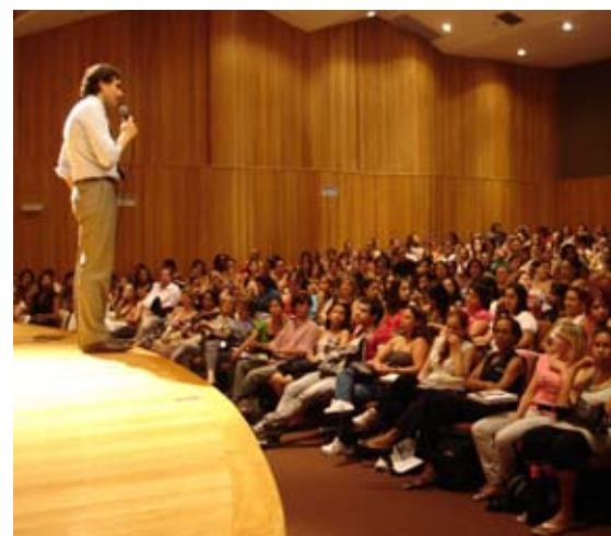
Participam professores, alunos e interessados

Na última apresentação – “A escola contemporânea - Integralidade na diversidade” – no dia 07 de abril, Chalita comentou sobre a Educação na atualidade e apontou melhorias. Para saber mais detalhes sobre as quatro palestras, acesse o portal da UNINOVE.