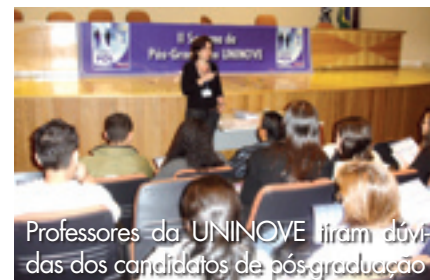
Professores da UNINOVE tiram dúvidas dos candidatos de pós-graduação