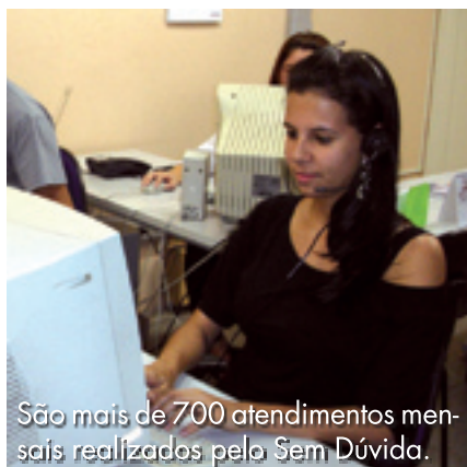
São mais de 700 atendimentos mensais realizados pelo Sem Dúvida.

Um canal de comunicação que aproxima a UNINOVE de sua comunidade acadêmica