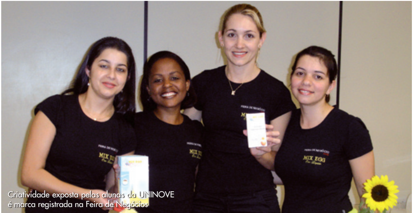
Criatividade exposta pelas alunas da UNINOVE é marca registrada na Feira de Negócios

UNINOVE prepara seus alunos para serem empreendedores