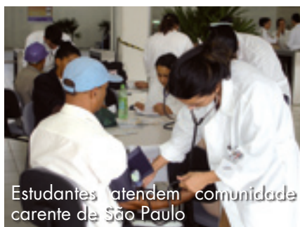
Estudantes atendem comunidade carente de São Paulo