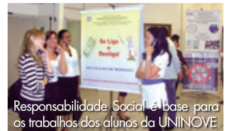
Responsabilidade Social é base para os trabalhos dos alunos da UNINOVE