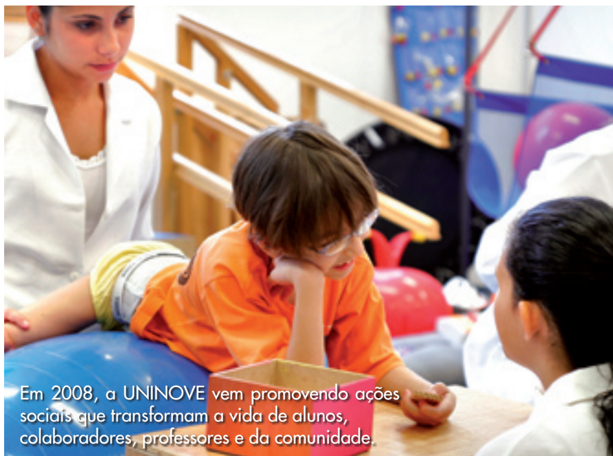
Em 2008, a UNINOVE vem promovendo ações sociais que transformam a vida de alunos, colaboradores, professores e da comunidade.