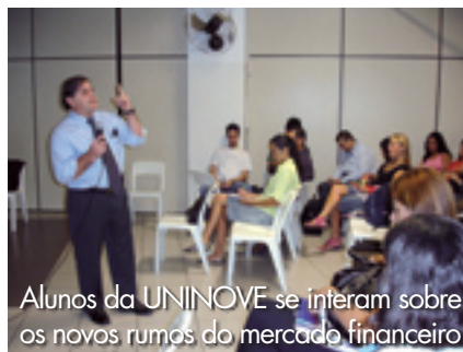
Alunos da UNINOVE se interessam sobre os novos rumos do mercado financeiro