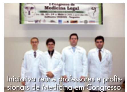
Iniciativa reúne professores e profissionais de Medicina em Congresso