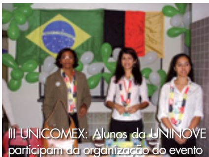
III UNICOMEX: Alunos da UNINOVE participam da organização do evento