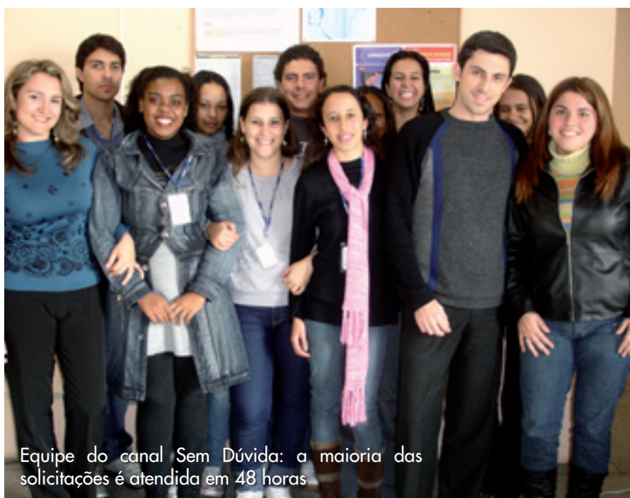
Equipe do canal Sem Dúvida: a maioria das solicitações é atendida em 48 horas