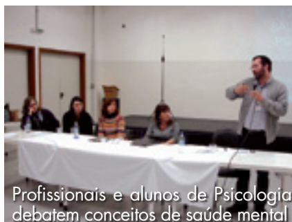
Profissionais e alunos de Psicologia debatem conceitos de saúde mental