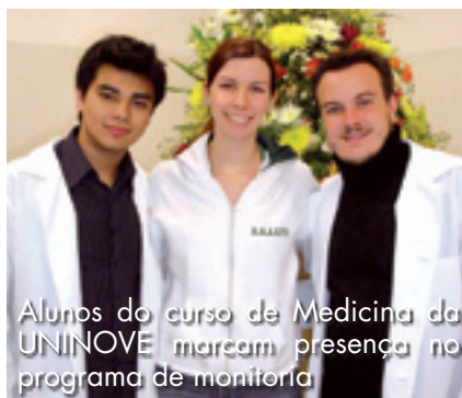
Alunos do curso de Medicina da UNINOVE marcam presença no programa de monitoria