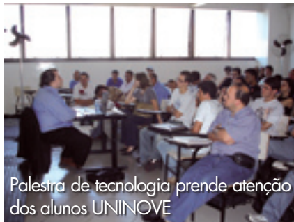
Palestra de tecnologia prende atenção dos alunos UNINOVE

nova metodologia Microsoft. Foram expostos como é realizado o mapeamento do objeto relacional, usando o índice framework, e questões como criptografia, mecanismos de segurança e outras tecnologias promovidas pela Microsoft.